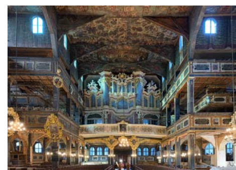
Friedenskirche Swidnica, 1657