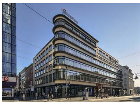
Warenhaus Petersdorff, 1928