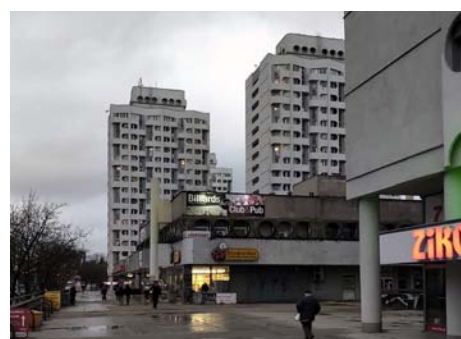
Plac Grunwaldzki, 1973