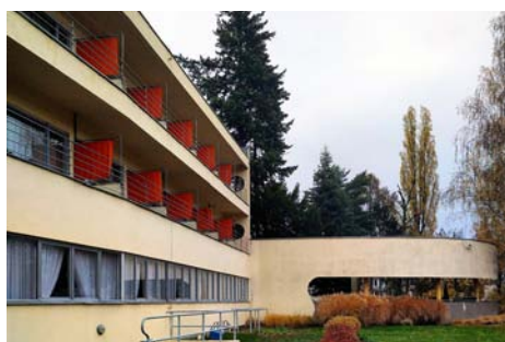
Ledigheim (WuWa), 1929